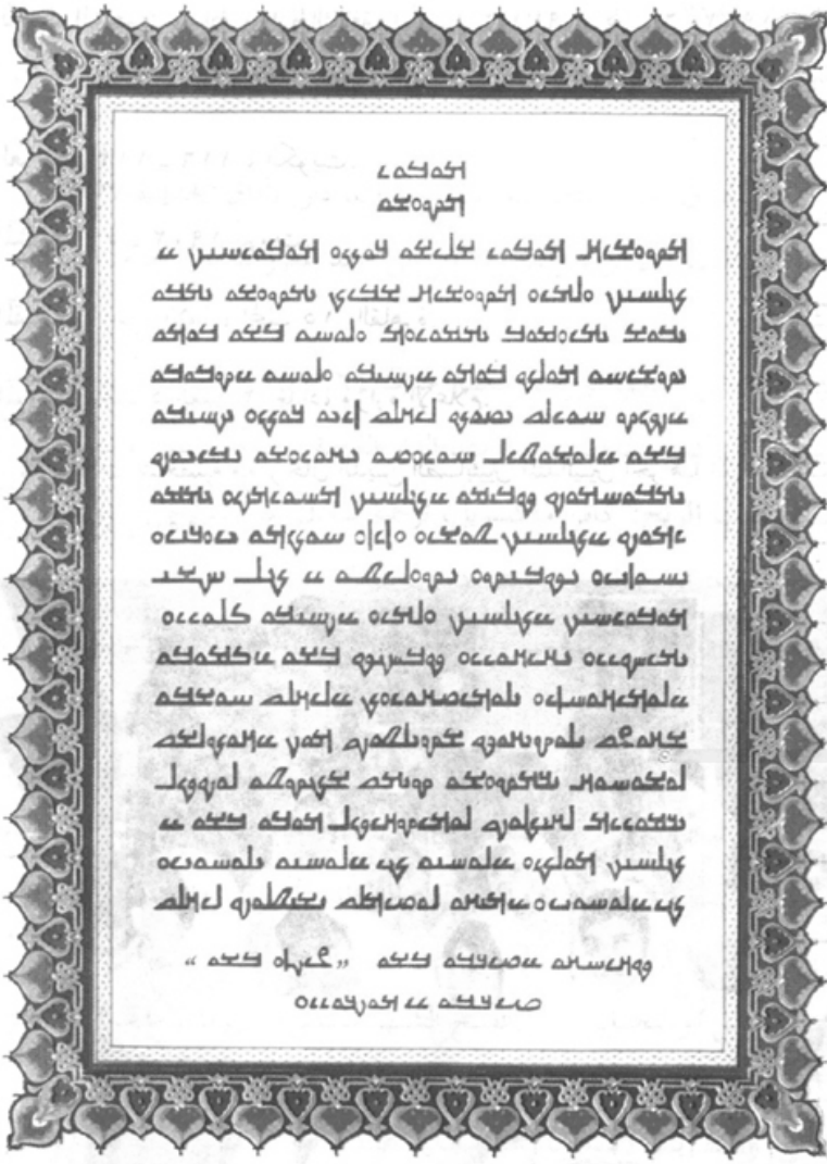
(الصورة: ١) افتتاحية (الكنز الربا) باللغة المندائية