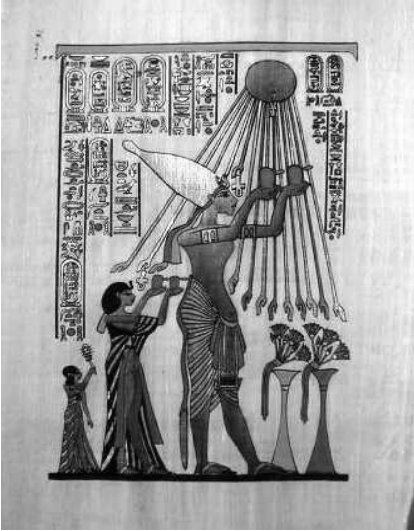
أخناتون يصلي للشمس مع زوجته نفرтитي وابنتهما ميريت (الصورة: ٤)