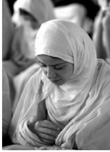
(الصورة: ٢) فتاة مندائية تؤدي الصلاة